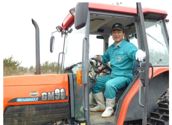
生産者はこんな人です

このように化学肥料を一切使わない農業を続けることにより、「健全な土」を次の世代に残し、「安全・安心」の環境にやさしく、体にもやさしい『 美味しいこだわりのエコ米 』を皆様に自信を持ってお届けすることができるのです。